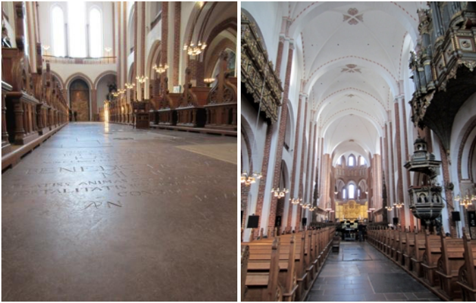
Domkirkens indre, gravstenen. Enevolds arbejdsplads.