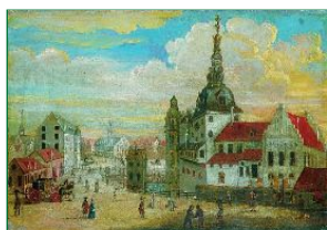
Københavns Slot på Slotsholmen, 1698.