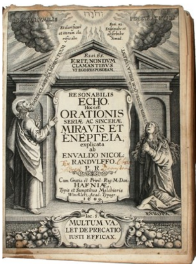
Enevold Randulff. Titelblad i bog om bønner, 1649.