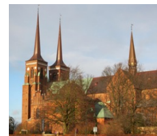
Roskilde Domkirke, centrum Enevold Randulffs arbejdsliv i stedet, hvor han er begravet.

Enevold Randulff døde i Roskilde den 30. april 1666 og blev begravet tæt ved alteret i Roskilde Domkirke den 11. maj 1666.