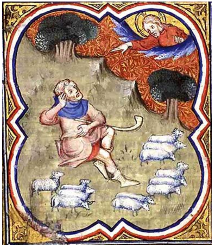
"Förkunna bland folken [att] Herren är konung!" (Psaltaren 96, 10)

Jag öppnar ett fönster på en sedan länge svunnen tid och jag upptäcker ett fascinerande värld, där en enkel man, genomgod och modig, from och rättfärdig ger sig i väg för att predika. Gud talar till honom. Han lyder, lämnar hus och mark, lämnar sina får, lämnar allting bakom sig, och ger sig iväg på okända vägar för att förkunna guds ord. Påminner inte Amos öde om apostlarnas, eller om dessa första missionärer som ingenting kunde stoppa, så stor var deras tro?