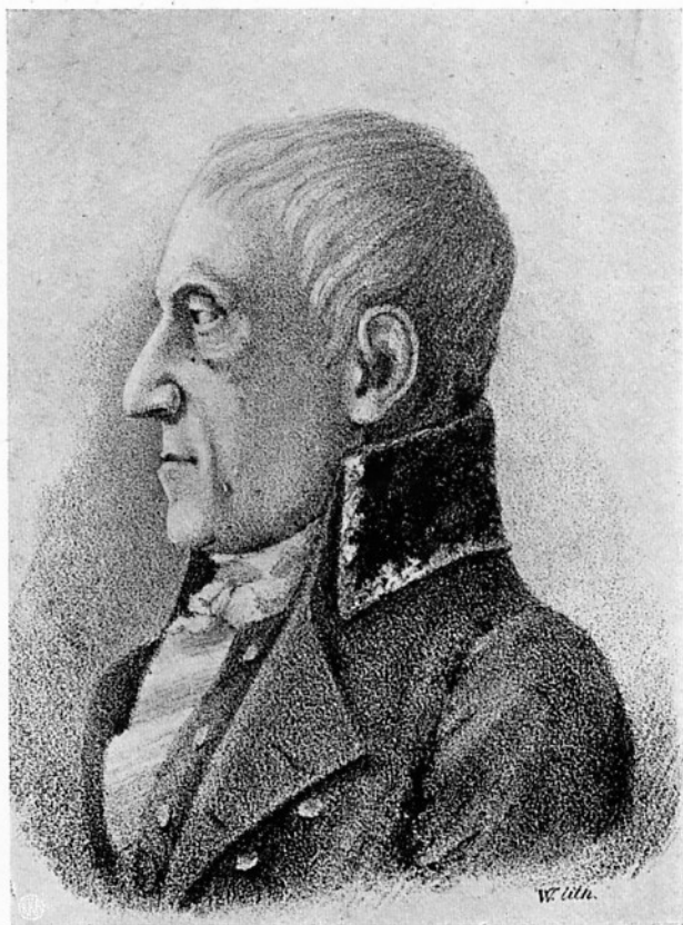
JUSTITIARIUS ENEVOLD DE FALSEN