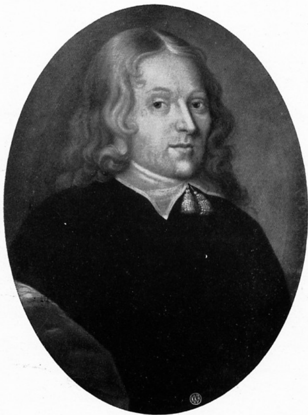
KONFERENTSRAAD ENEVOLD DE FALSEN