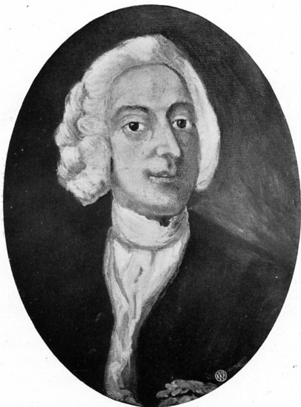
JUSTITIARIUS CHRISTIAN MAGNUS DE FALSEN