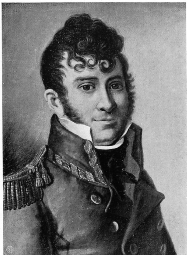
EIDSVOLDSMANDEN CHRISTIAN MAGNUS FALSEN